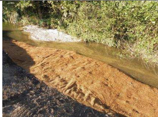
Création de banquettes végétales et minérales