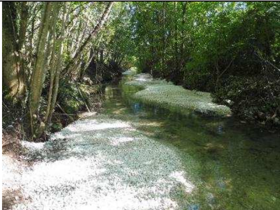
Mise en place de banquettes minérales