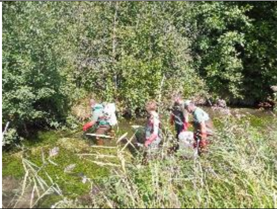
Pêche de sauvegarde

Voici l'illustration des différentes démarches :