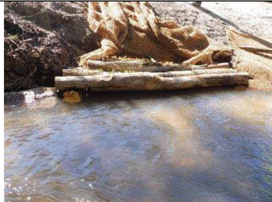
(Essai) Création de sous-berges / caches piscicole