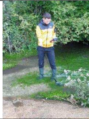
Suivi de l'oxygène