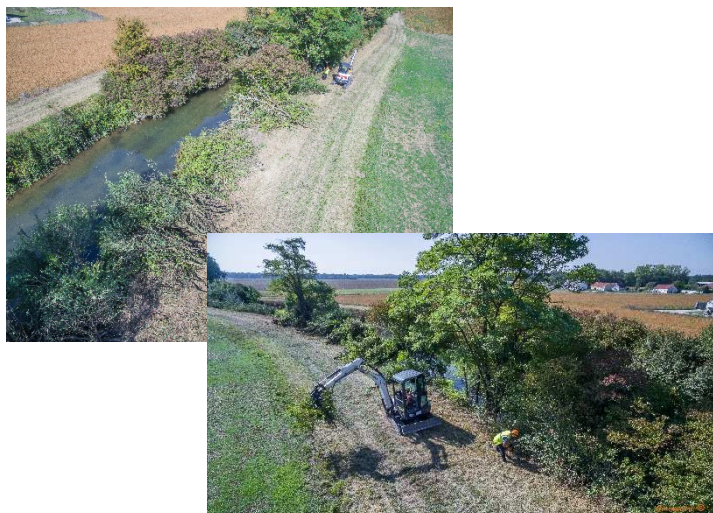
Le traitement préalable de la ripisylve (sept. 2018)