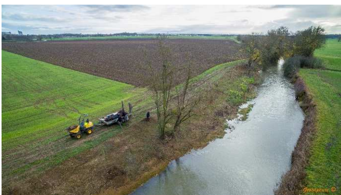
L'implantation d'une nouvelle ripisylve (déc. 18)