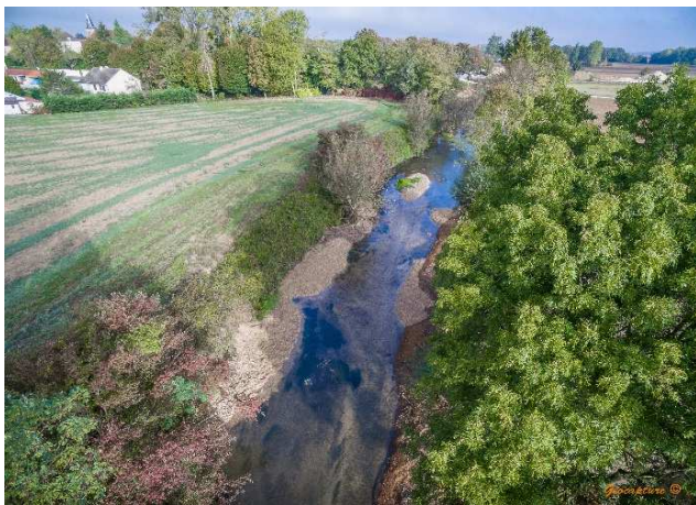
La recharge granulométrique (oct.18)