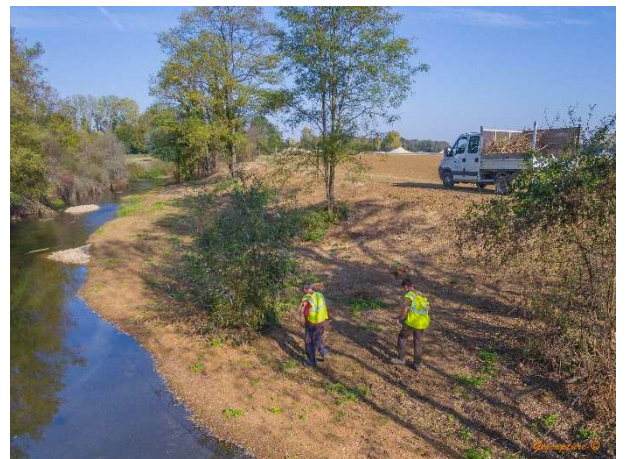
L'ensemencement des banquettes (oct.18)