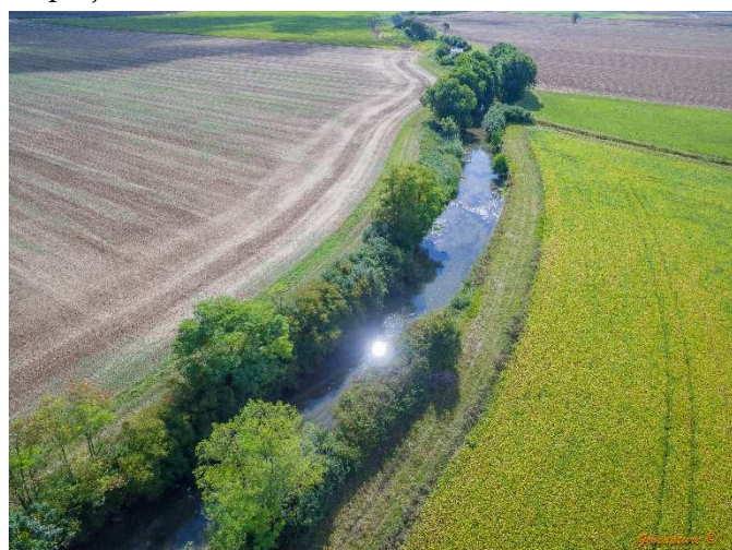
La Vouge vue du ciel - avant intervention (août 18)

Depuis plusieurs années désormais, le SBV travaille sur des projets de restauration physique des cours d'eau du bassin de la Vouge. Suite à une concertation jamais mise en défaut et un véritable échange avec l'ensemble des partenaires que sont les élus et représentants des communes de Brazey en Plaine, d'Aubigny en Plaine, de la Communauté de communes Rives de Saône, des agriculteurs, des riverains,... et bien sûr des élus siégeant au syndicat, le projet de restauration de la Vouge, sur une longueur de 620 mètres linéaire, s'est concrétisé durant l'automne 2018. Les longs discours ne valant pas les images, découvrez les différentes étapes du projet et son rendu final :